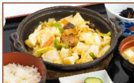
豚肉と味噌野菜炒め定食 (ご飯・味噌汁・小鉢付) 税込850円