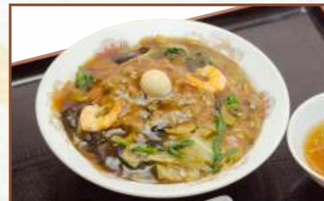
五目あんかけ焼きそば (中華スープ付) 税込780円