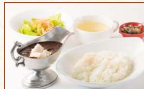
ブラックカレー (サラダ・スープ付) 税込780円