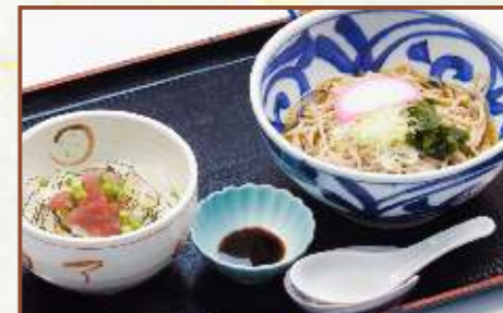
まぐろブツ丼とそば定食 (そばの温・冷選べます) 税込780円