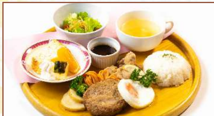
ワンプレートハンバーグ ドリンクバー付き (ハンバーグ・ライス・スープ・サラダ・デザート) 税込1,100円