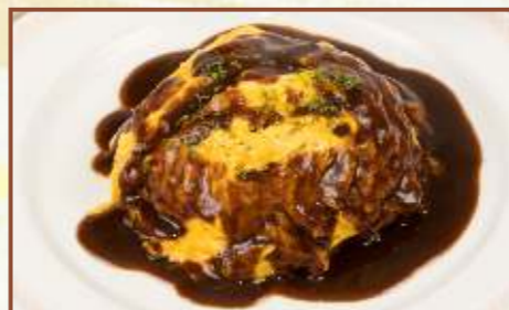
オムライス (スープ・サラダ付) 税込800円