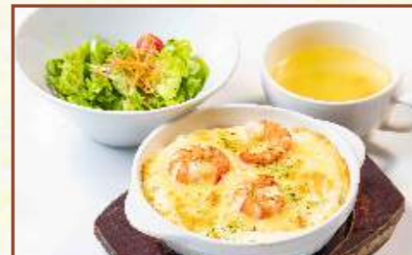
エビドリヤ (スープ・サラダ付) 税込880円