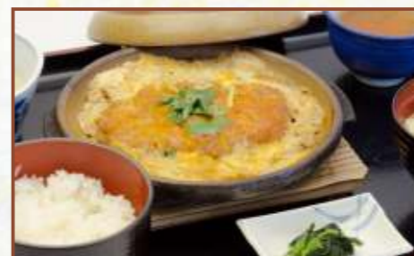
カツ煮込み定食 (ご飯・味噌汁・小鉢付) 税込850円