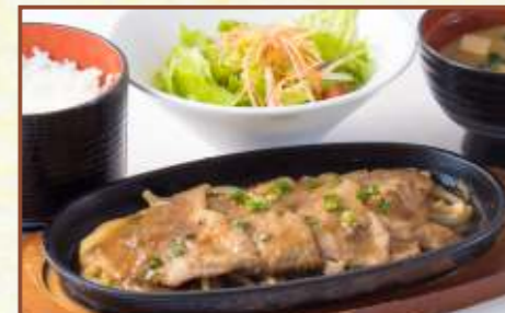
鉄板生姜焼 (スープ・サラダ・ライス付) 税込950円