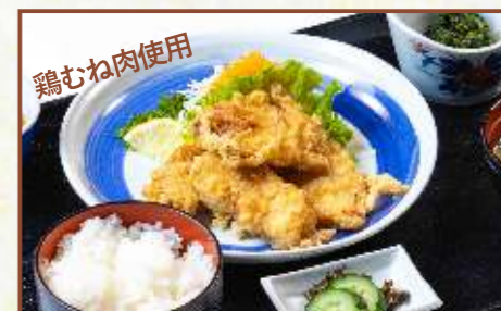
ヘルシー鶏からあげ定食 (ご飯・味噌汁・小鉢付) 税込800円