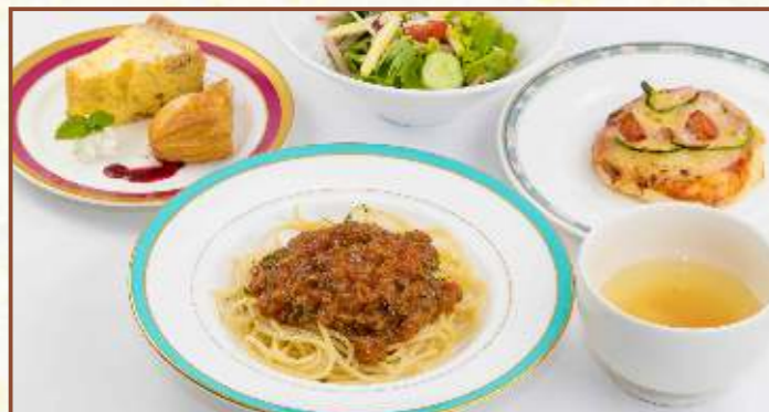
レディースセット (パスタ・ピザ・スープ・サラダ・デザート) 税込900円