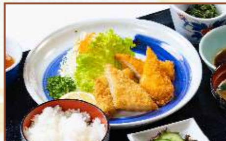
白身魚&イカフライ定食 (ご飯・味噌汁・小鉢付) 税込800円