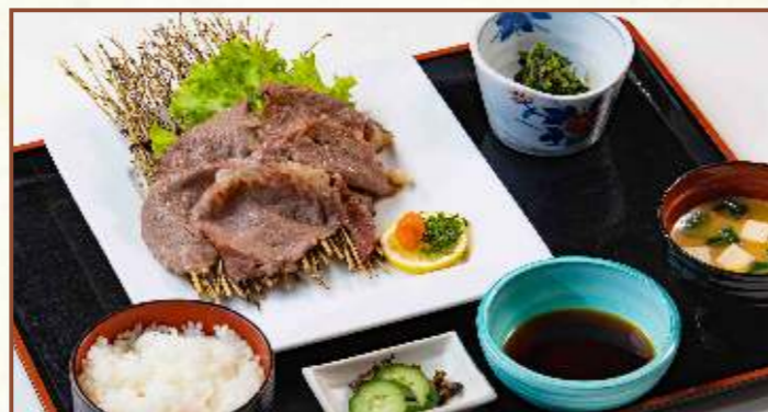
福島牛網焼き定食 (ご飯・味噌汁・小鉢・お新香付) 税込2,500円