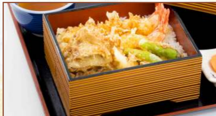
海老天重 (味噌汁・小鉢付) 税込980円