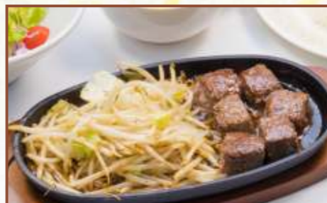
サイコロステーキ (スープ・サラダ・ライス付) 税込1,050円