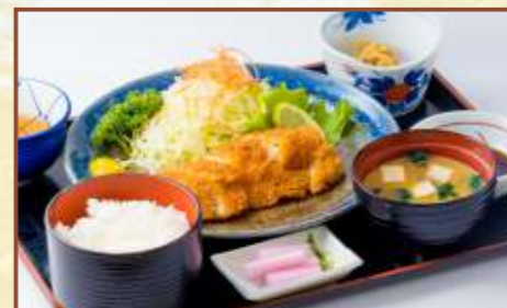
チキンカツ定食 (ご飯・味噌汁・小鉢付) 税込800円