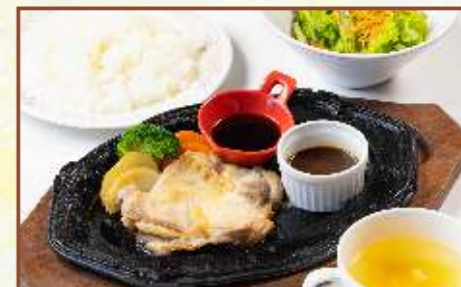
鉄板チキングリル2種のソース (スープ・サラダ・ライス付) 税込870円