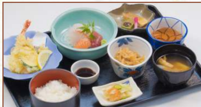
彩り膳 (天ぷら・刺身・焼き魚・ご飯・味噌汁・小鉢) 税込1,400円